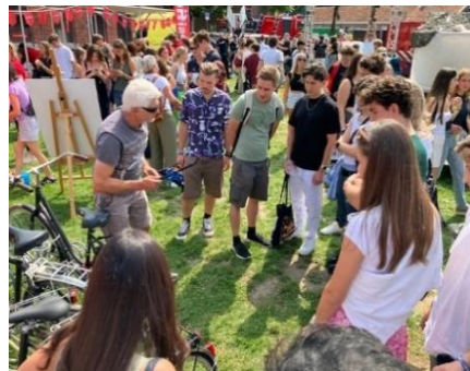
Nieuwe studenten Maastricht trappen af op Inkom: 'In Spanje parkeren we de fiets overal'