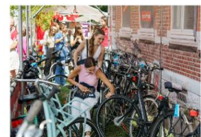
Maastricht: Direct bij de aftrap van de Inkom, de introductieweek voor nieuwe studenten in Maastricht, begint de gemeente met het duidelijk maken van bepaalde regels. Daarbij zet men vol in om bewustwording van eventuele overlast bij studenten te creëren.